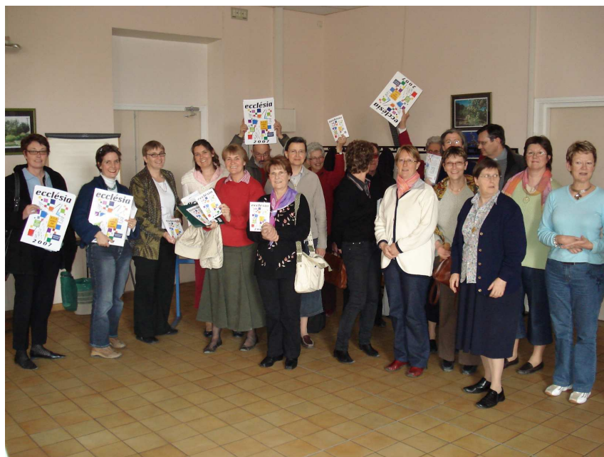
Des participants à la journée de Marseille découvrent le logo d'Ecclésia 2007

Plus de 150 personnes venant de 70 diocèses ont participé aux trois journées de préparation d' Ecclésia 2007 qui ont eu lieu le lundi 26 mars à Paris, le mardi 27 mars à Toulouse et le vendredi 30 mars à Marseille. Une belle participation sous le signe de la diversité puisque responsables et membres de services diocésains de catéchèse, catéchuménat, formation permanente, aumônerie, liturgie, pastorale familiale, pastorale spécialisée, service de communication, mouvements ou catéchistes de paroisses, étaient présents. Chacun a exprimé ses motivations, ses souhaits, s'est informé sur les modalités d'organisation du congrès et a planché sur les différents axes des forums de partage de réalisations locales.