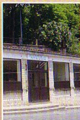
Les locaux d'accueil sont très vétustes : tout est à reconstruire.