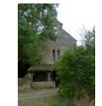
7. - Lahitte Saint-Loup