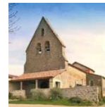
10. - Saint-Cirice Saint-Cirice